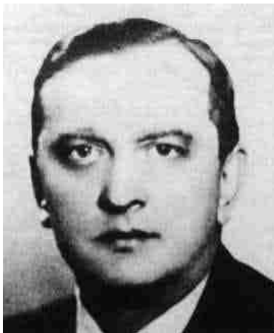
Figura: Stefan Banach (1892 - 1945) a fondat analiza funcțională modernă și a avut contribuții majore în teoria spațiilor liniare topologice, teoria măsurii, integrare, serii ortogonale.